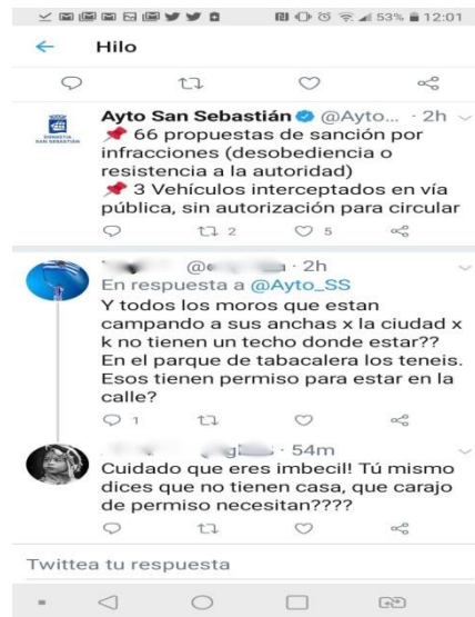
Figura 4. Comentarios en respuesta al mensaje del Ayuntamiento de San Sebastián sobre las sanciones ( https://twitter.com/Ayto_SS ).

Por otro lado, frente a esta situación también nos hemos encontrado con buenas prácticas por parte de la ciudadanía y de los movimientos sociales que van desde la visibilización y denuncia de esta realidad, hasta actuaciones concretas para dar respuesta a las necesidades añadidas que las personas sin hogar tienen durante el estado de emergencia.