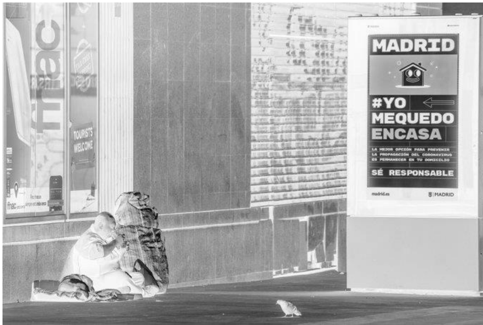
Imagen de una persona sin hogar junto a un cartel de #YoMeQuedoEnCasa del Ayuntamiento de Madrid ( https://twitter.com/superfrog89/status/1241167156609536004 ).