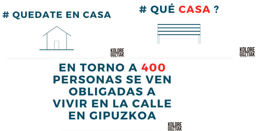
Figura 5. Imagen protesta para visibilizar la situación de las personas sin hogar ( https://www.facebook.com/koloreelkartea/videos/2351912504910652/ ) .